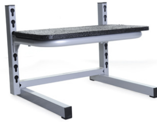
Varenummer: Varebeskrivelse: 131-003620 Trappetrinn justerbar