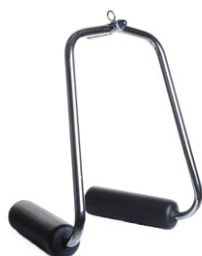
Varenummer: Varebeskrivelse: 131-00640 Avlastningsbøyle