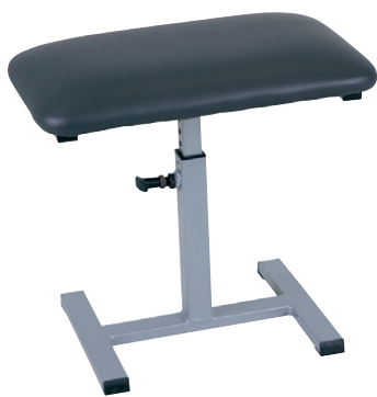
Varenummer: 114-213-00 Varebeskrivelse: MTT krakk