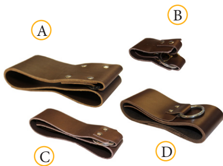
Varenummer: Varebeskrivelse: 402155 A Stropp Skulder 402156 B Stropp Håndledd 402157 C Stropp Ankel 402158 D Stropp 8 x 100 cm 402159 D Stropp 8 x 150 cm