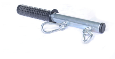
Varenummer: Varebeskrivelse: 139-028947 Pronasjon/supinasjonhåndtak