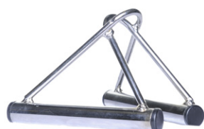
Varenummer: Varebeskrivelse: 139-028937 Rohåndtak