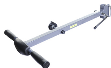
Varenummer: Varebeskrivelse: 130-028939 Støtthåndtak med hjul