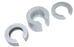
Varenummer: Varebeskrivelse: 230-32 Ekstravekt 0,5 kg 230-33 Ekstravekt 0,25 kg 230-34 Ekstravekt 0,1 kg