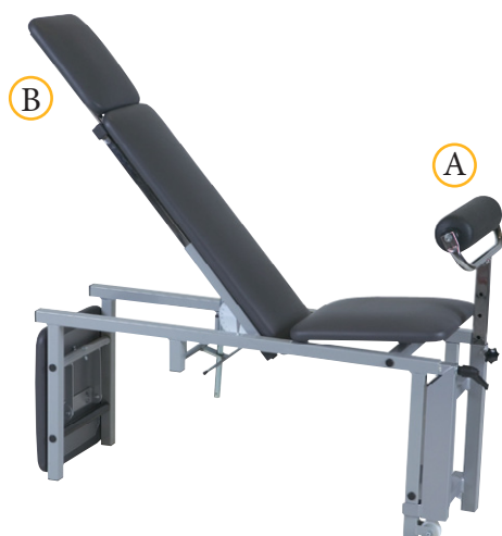
Varenummer: 136-012902 Varebeskrivelse: 3-delt benk 136-028930 A Mobilisasjonspute 136-012902 B Ryggforlenger