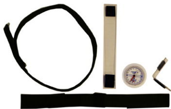
Varenummer: Varebeskrivelse: 139-711432 Goniometer, Myrin