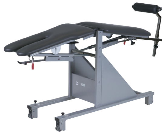
Varenummer: 135-150-00-GAS Varebeskrivelse: Vinkelbenk