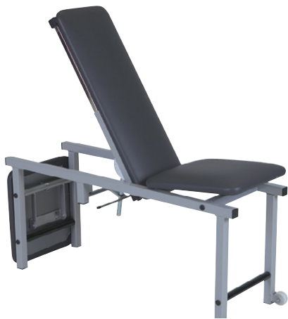
Varenummer: 136-012902 Varebeskrivelse: 3-delt benk