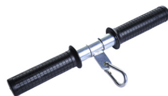
Varenummer: Varebeskrivelse: 139-028938 Tricepsstang 139-028946 Tricepsstang rotating