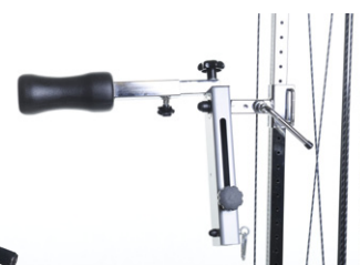
Varenummer: Varebeskrivelse: 130-215 Nakketrener