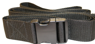
Varenummer: Varebeskrivelse: 102-710563 Traksjonsbelte