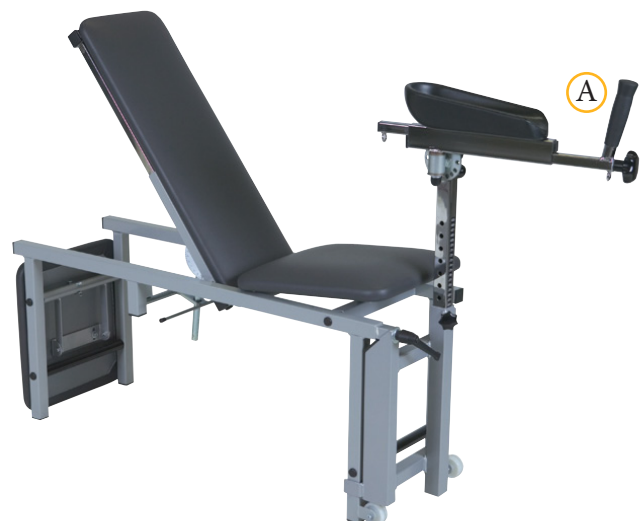
Varenummer: 136-012902 Varebeskrivelse: 3-delt benk 136-028936 A Skulderrotasjonstrener