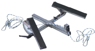
Varenummer: Varebeskrivelse: 131-000670 Fotstøtte