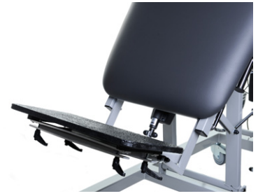
Varenummer: Varebeskrivelse: 145-012938 Fotplate